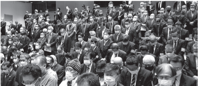
2月5日に逝去された宮里邦雄弁護士を偲び、黙とう。日本の労働弁護士を代表する存在として、数え切れない労働者が救われました